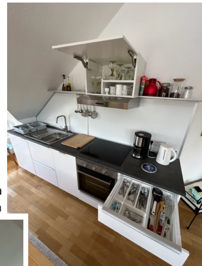
Küche mit Essbereich und Zugang zum Balkon