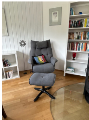
Schlafzimmer mit 1 Kingsize-Doppelbett, Arbeitsplatz und Lesecke